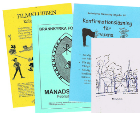
Tryckta alster innan den nya grafiska profilen

Det var snart tydligt att uppdraget omfattade ganska mycket mer än »ett koppel dummies och mallar». Förutom logotyp ville man ha nya brevpapper och kuvert, visitkort, informationsblad, symboler för de båda kyrkorumen samt vinjetter för olika kyrkliga aktiviteter som barnverksamhet, körsång med mera. Församlingens informationsblad Brännkyrka-bladet (som distribueras som en bilaga i Mitt i Söderort) skulle också få sig en överhaling. Dessutom måste hemsidan göras om efter den nya grafiska profilen – det sistnämnda återstår ännu att göra.